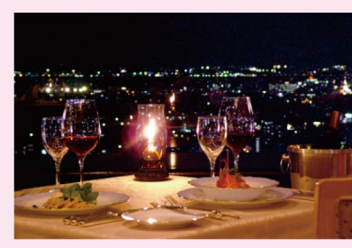
お好みの日時にご予約いただけます

フェア期間中に「25万円以上の婚約指輪」または「ペア30万円以上の結婚指輪」をご成約いただいたお客様をもちろん、素敵な夜景を楽しめる『オークラアクトシティホテル浜松』30階レストラン『パガニーニ』でのペアディナーにご招待いたします。美しい夜景の見える高層階で特別なディナーをお楽しみください。