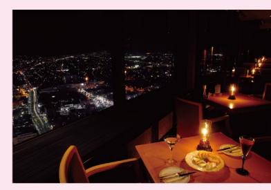
素敵な雰囲気です。忘れられない時間を

オークラアクトシティホテル浜松 フランス料理『パガニーニ』のペアディナーにご招待