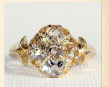
17世紀後半、マザランカットが登場した頃の指輪。ダイヤ5石を組み合わせた秀逸なデザイン。