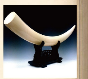
磨き上げられたアイボリー。希少価値は年を追うごとに上がるばかり。