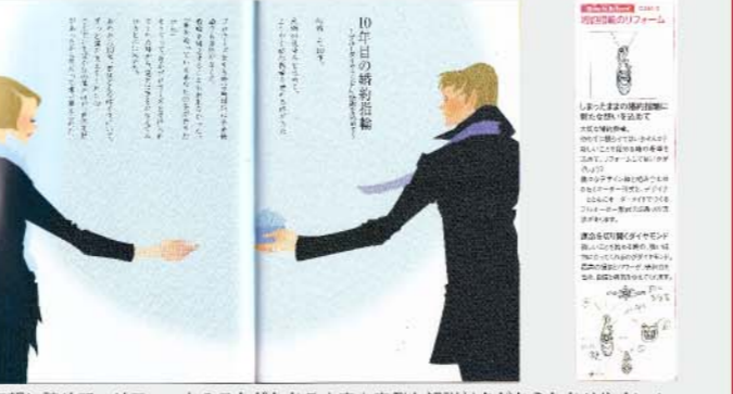
気軽に読んで、リフォームのことがわかる内容! 実例も解説付だからわかりやすい!

『幸せの記憶 ~大切な想いをジュエリーに込めた7つの物語~』 ジュエリーリフォームにまつわる物語が描かれた冊子「幸せの記憶」を無料プレゼントいたします。ジュエリーに秘められた様々な想いと、生まれ変わってまた命を吹き込まれるジュエリーにまつわる7つのものがたり。リフォームの実例も解説されているので、気軽にジュエリーリフォームのことがわかります。「リフォームには興味があるけど、よくわからない…」という方にぜひ読んでほしい一冊です。店頭のほか、メール便での発送を行っていますので、ぜひお気軽にお問い合わせください! お問い合わせはアトリエフィロンドールまで フリーダイヤル 0120-891-109、または email : filondor@nifty.com 「リフォームの絵本を送ってください」とお伝えください。