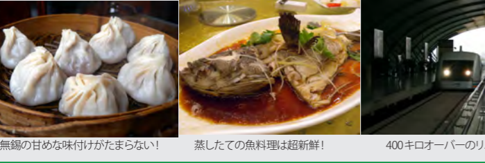
無錫の旨めな味付けがたまらない! 蒸したての魚料理は超新鮮! 400キロオーバーのリニアも体験

さて、肝心のジュエリー販売の現場は、10年前の日本を見ているような感覚でした。一 部の超高級ブランドを除いて、プラチナやホワイトゴールドの細めの指輪が雑然と並ん だっている印象。ブライダル専門のショップやブランドはまだわずか、上海の平均年収か らいくとまさに3カ月分程度が相場のようなです。印象的なのは、男性のリングにもダイア モンドがしっかりと入っていること。このあたりの感覚は少し進んでいるのかも知れませ ん。これからどうなるのがかとも楽しみ。 書ききれない程の出会いと勉強をして、時速430キロのリニアモーターカーにゆられて 上海を渡ったのでした。中国、これからは目が離せません!