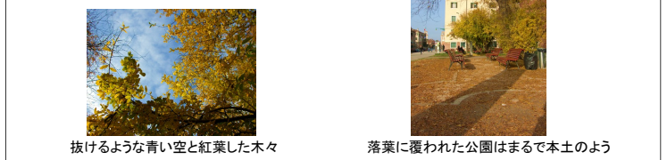
抜けるような青い空と紅葉した木々 落葉に覆われた公園はまるで本土のよう