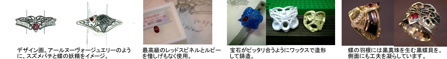
デザイン画。アールヌーヴォージュエリーのよう に、スズメバチと蝶の妖精をイメージ。 最高級のレッドスピネルとルビー を惜しげもなく使用。 宝石がピッタリ合うようにワックスで造形 して鋳造。 蝶の羽根には黒真珠を生む黒蝶貝を。 側面にも工夫を凝らしています。

結婚10周年の記念リングを制作しました。アールヌーヴォー好きなご主人のリクエストで奥様に「蝶の妖精」リング。妖 精が手に持つのは、世界最高の、ミャンマー産ナチュラル(非加熱)・ジェムクオリティールビーです。羽根にはアゲハ蝶の ような玉虫色をした黒蝶貝をカットして入れ、ダイヤもちりばめています。 御主人用はシルバー製で「VESPA(スズメ蜂)リング」を製作。こちらの石も、大変美しいミャンマー産のナチュラル(非加 熱)レッドスピネルです。かなり大きなリングにはなりますが、スズメ蜂のスタミナで元気が出そうなるリングになりました。この リングがお二人の絆をより強くしてくれたらこんなに幸せなことはありません。〇様、ありがとうございました！