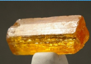
硬くても、「へき開」という性質を持つテリ ケートな宝石

黄金の輝きを放ち、シェリー酒のような深みのある色の宝石、トパーズ。 黄色が強い「シトリン」という宝石と混同されてしまうことが多いのですが、全く別のもので、価格も大きく違うので注 意が必要です。「黄色い水晶」であるシトリンを売りたいがために「シトリントパーズ」という商業名をつけて販売した 業者があったため、黄水晶はトパーズであるかのような付加価値がつけられ、一方のトパーズは黄水晶のような 一流とはいえない扱いをうけるという憂き目にあってしまいました。 トパーズの語源にはいくつかの説がありますが、有力なのはギリシャ語で「探し求めるもの」という意味の 「topazos(トパゾス)」といわれています。古代、探掘される島がいつも霧に隠れていたため、皆が命をかけて探し 求めたそうです。(現在では、ベリドットと名前が入れ替わってしまったとされています。) 特に、ブラジルで産出される、シェリー酒のような深い色をしたトパーズは「インペリアル(皇帝の)トパーズ」と呼 ばれて特に珍重されます。今では美しいものが手に入りやすく、注目が集まりはじめています。シャンパンゴールド をはじめ、華やかで上品な色はワンランク上の印象を与えてくれます。 プラチナやゴールドをはじめ、貴金属の光沢とよく合う、ちょっと大きめの存在感の石に挑戦してみるのはいかが ですか？